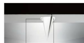
手掛かり部(Lタイプ) 手掛かり部(Uタイプ)

手掛かり部LタイプとUタイプの扉を組み合わせる事で扉の隙間を目立ちにくい仕上がりになりました。扉の上から下まで手掛かり部(Lタイプ、Uタイプ)がありますので、子どもから大人までご使用いただけます。取っ手を取り付けないことで、特に出っ張りの気になる動線上の収納扉に最適です。