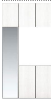
W1200 コの字 (ミラー付)